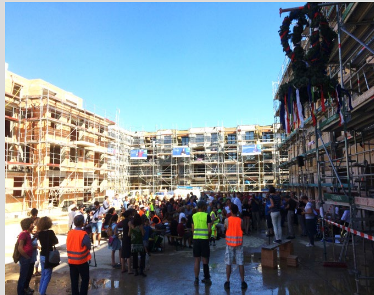
Wunschnachbarn Baugruppen August 2016