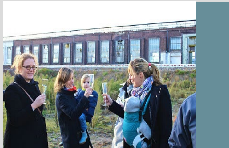
Kwartier 733 Baugruppen September 2016